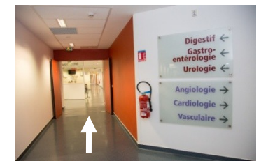
Service Consultation Secteur Digestif